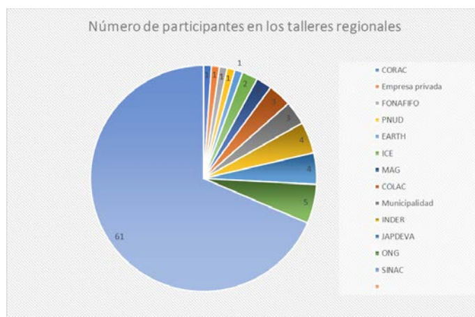
Figura 2 Actores participantes en los talleres regionales

Participaron 89 personas, de los cuales el 89 % fueron funcionarios del SINAC y 11 % representantes de otros actores con incidencia nacional, regional y local. Ver figura 2. Entre los cuales el 11 % fueron mujeres y 89 % hombres.