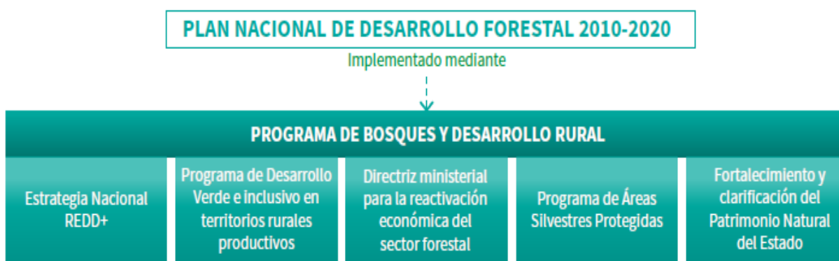
Figura 1. Plan Nacional de Desarrollo Forestal y su relación con las diferentes iniciativas del sector forestal impulsadas por el gobierno de Costa Rica. Fuente: Estrategia Nacional REDD+

Actualmente el gobierno de Costa Rica está impulsando diversas iniciativas para fortalecer el sector forestal. Dentro de estas iniciativas se destaca el Programa de Bosques y Desarrollo Rural el cual busca lograr operativizar la implementación del PNDF con el apoyo de aquellas instancias que trabajan en la gestión del sector forestal (Fig.1).