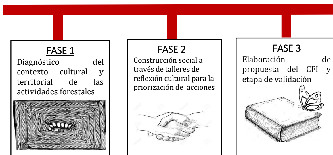
Figura 3. Fases implementadas para la construcción del CFI

La construcción del CFI se inició desde junio del 2018 y se fundamentó en un proceso participativo que involucró la participación de unas 146 personas de los 8 pueblos indígenas de Costa Rica. La construcción del CFI tomó en cuenta las siguientes fases: