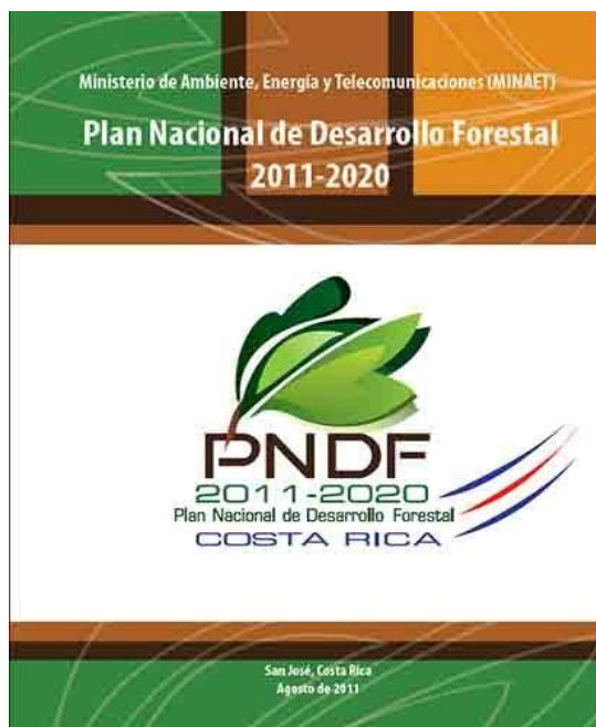
Figura 2. Plan Nacional de Desarrollo Forestal 2011-2020

El Plan Nacional de Desarrollo Forestal por lo tanto ofrece una visión estratégica de la gestión forestal a nivel nacional y tiene una vigencia de 10 años. Hasta el momento se han elaborado dos PNDFs. El primero se elaboró del 2001-2010 y el más reciente del 2011-2020. El PNDF busca trascender periodos de gobierno con el fin de orientar el desarrollo de políticas, programas y proyectos tendientes a impulsar un desarrollo forestal sostenible para el país a lo largo del tiempo. El PNDF también busca integrar a los actores relevantes que tienen una relación con los recursos y ecosistemas forestales. El plan toma en cuenta diferentes sistemas que abarcan el componente forestal como los bosques, plantaciones forestales, sistemas agroforestales y la producción de bienes y servicios ecosistémicos. Este también es un marco de referencia a nivel nacional que busca reconocer el valor y la importancia que tienen los bosques para la sociedad costarricense. El PNDF considera también aspectos institucionales para su coordinación e implementación con el fin de fortalecer y visibilizar las relaciones, conexiones y actores relevantes vinculados al sector forestal (PNDF 2011).