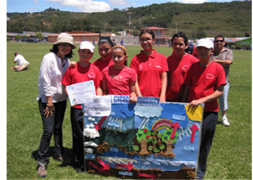
ASADA QUEBRADILLA. Cartago-Festival del Agua -Marzo 2010

Es necesario también referirse a otro asunto interesante que surge a raíz de la comparación de los casos. Los proyectos que son ejecutados por organizaciones con mayor nivel de profesionalización -esto es que cuentan con trabajadores que reciben salarios, sus dirigentes tienen estudios superiores o avanzados y experiencia en manejo de proyectos- son mucho más exitosos que aquellos que son manejados por personas con menos capacidades de gestión o sin estudios formales. Sin embargo este hallazgo pone al PPD en una encrucijada, pues es posible que en términos medioambientales esas organizaciones más profesionales tengan mayor impacto en términos de conservación de ecosistemas, pero generan un liderazgo vertical en las comunidades. Mientras que las organizaciones de base comunal pero con menos capacidades tienen más potencial de movilización horizontal pero sobre todo tienen un efecto de empoderamiento de sus dirigentes que en el largo plazo puede incluso ser más positivo para los esfuerzos de conservación. La filosofía del PPD pareciera indicar que el cambio hacia la conservación ambiental pasa por el fortalecimiento de los grupos de base, por lo que la aparente encrucijada parece resolverse si se plantea como eje prioritario de los proyectos la capacitación de los dirigentes y el mejoramiento de sus capacidades de gestión.